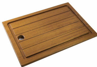
Planche de découpe en bois Iroko 8643 117