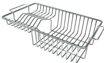
Grille porte-assiettes inox 8100 305