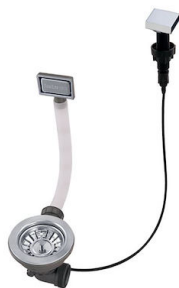
Vidange automatique - PM 8407 113